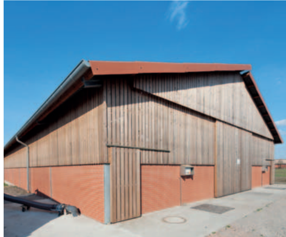
Neubau Schüttguthalle mit Tankplatz in Heek BVH: Raiffeisen Coesfeld - Ahaus eG