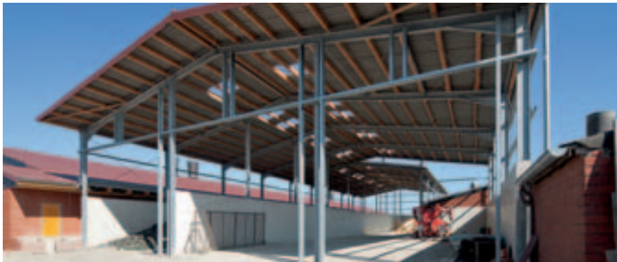
Neubau von Schweineställen und einer überdachten Fahrsiloanlage BVH: Jeller, Dülmen