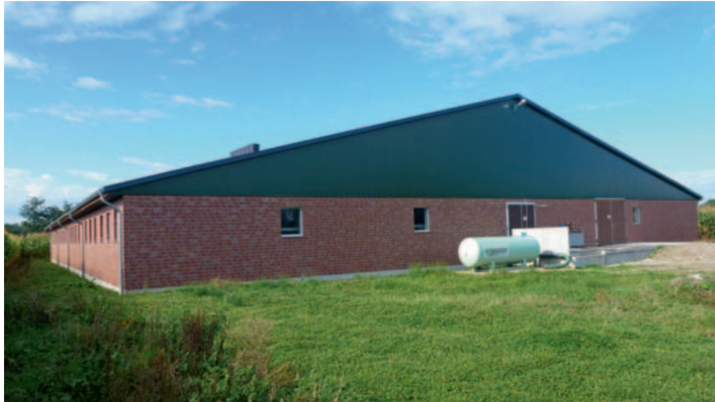
Neubau Schweinemaststall BVH: Ellerkamp, Alstätte