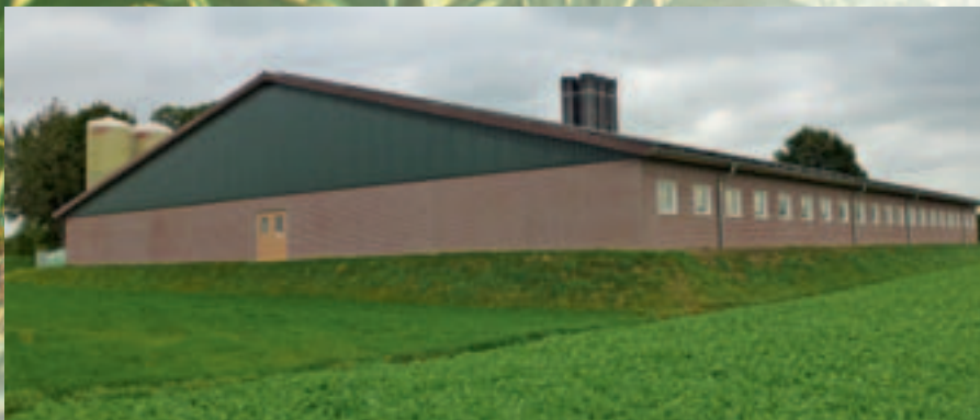
Neubau Schweinemaststall und Maschinenhalle BVH: Schulze Iking, Gescher