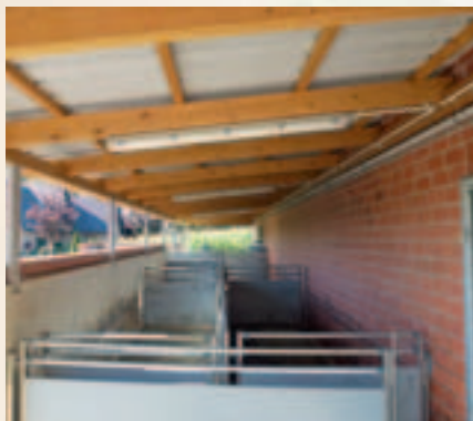
Neubau Schweinemaststall BVH: Schmitz, Alstätte