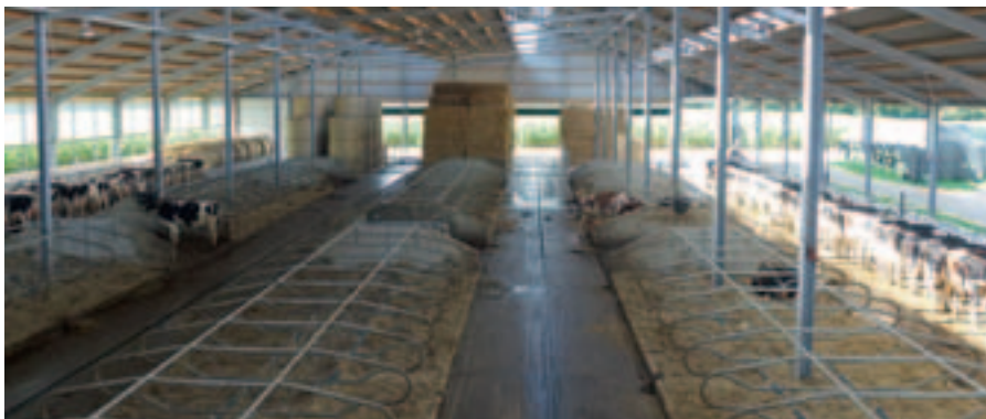
Neubau Milchviehstall BVH: Berger, Heiden