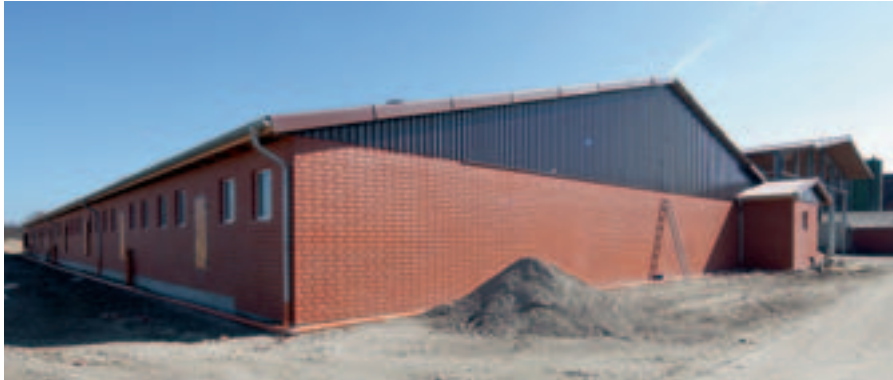
Neubau und Erweiterung von Schweineställen BVH: Ostendorf, Ochtrup