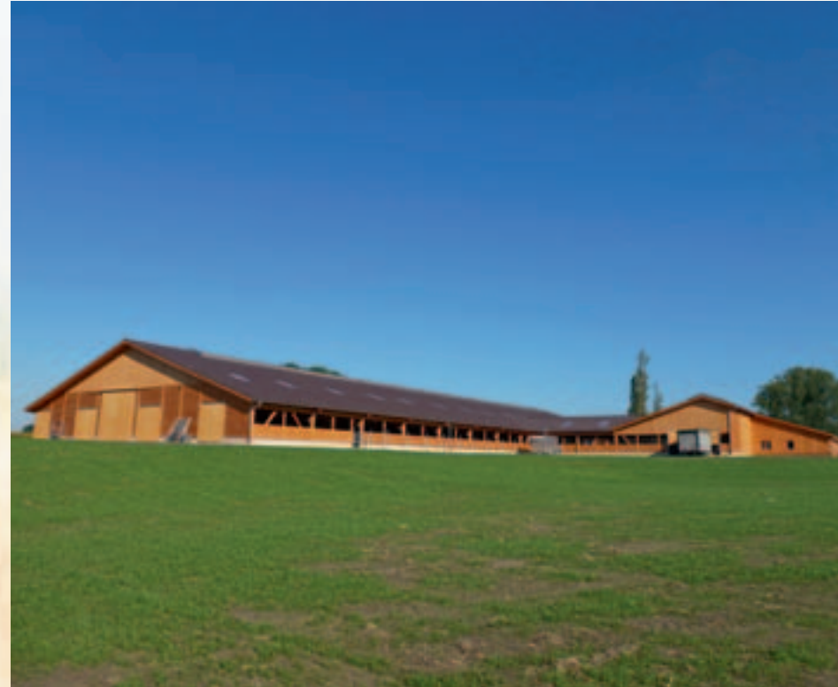
Neubau Milchviehstall BVH: Heßling, Rhade