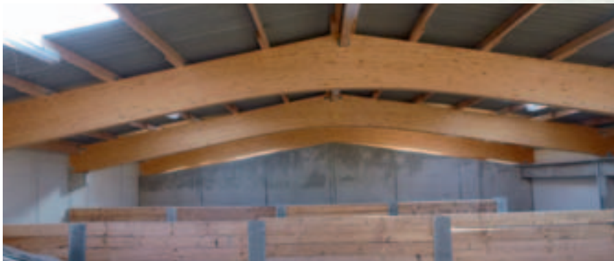
Neubau Aussiedlerhof BVH: Schulze Austrup-Strey, Lüdinghausen