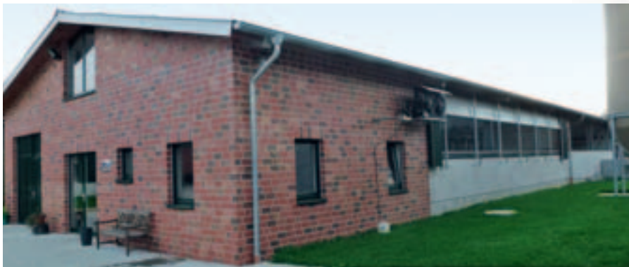
Neubau Fahrsiloanlage BVH: Menker, Gescher