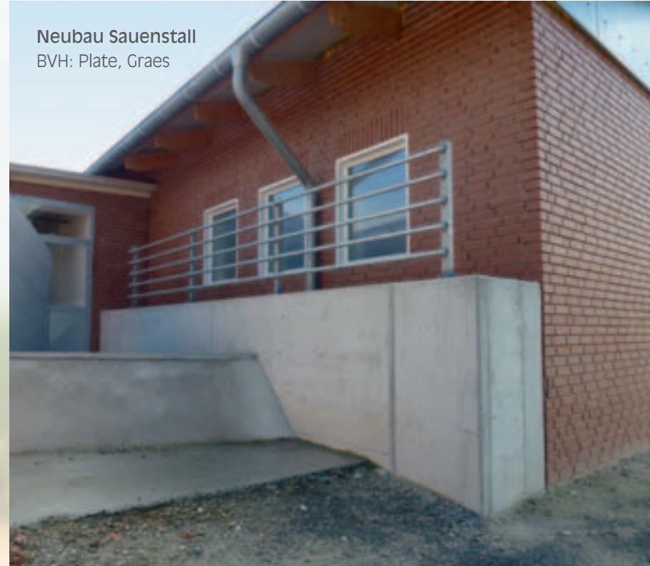
Neubau Sauenstall BVH: Plate, Graes